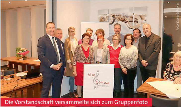
Die Vorstandschaft versammelte sich zum Gruppenfoto