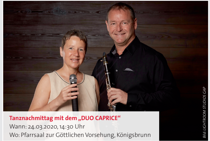
Tanznachmittag mit dem „DUO CAPRICE“