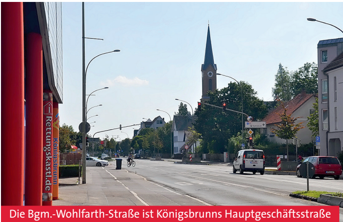
Die Bgm.-Wohlfarth-Straße ist Königsbrunn's Hauptgeschäftsstraße

gestaltet. Eine bedeutende Rolle spielt die Bürgermeister-Wohlfarth-Straße auch bei den traditionellen Marktsonntagen und beim Königsmarkt. Über 200 Fieranten bieten hier ihre Waren feil. An diesen Tagen haben viele Königsbrunner Geschäfte von 11.00 bis 16.00 Uhr geöffnet und laden somit zu einem ungezwungenen Einkaufsbummel mit der ganzen Familie ein.