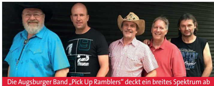
Die Augsburgs Band „Pick Up Ramblers“ deckt ein breites Spektrum ab

Was: Frühjahrskonzert des Kammerorchesters Wann: 22.03.2020, 17 Uhr Wo: Gemeindezentrum St. Johannes, Königsbrunn