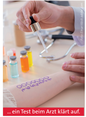
... ein Test beim Arzt klärt auf.