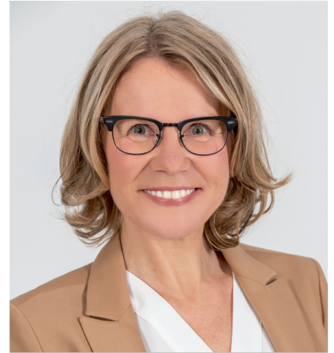
Kirsi Hofmeister-Streit, Bündnis 90/Die Grünen