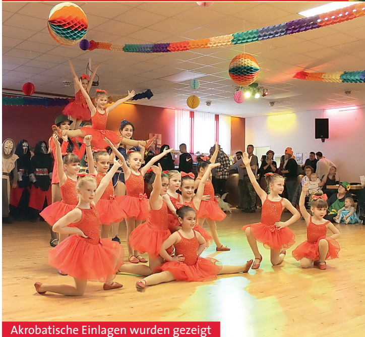
Akrobatische Einlagen wurden gezeigt