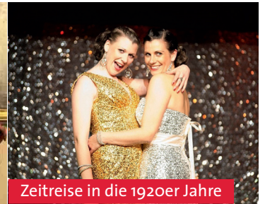
Zeitreise in die 1920er Jahre