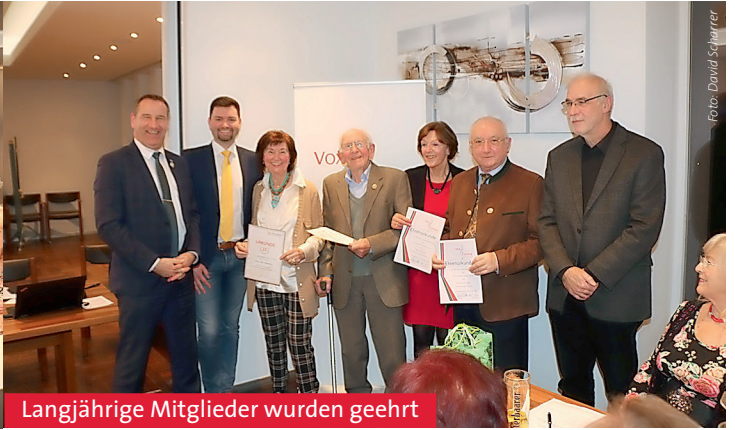
Langjährige Mitglieder wurden geehrt