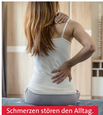
Schmerzen stören den Alltag.