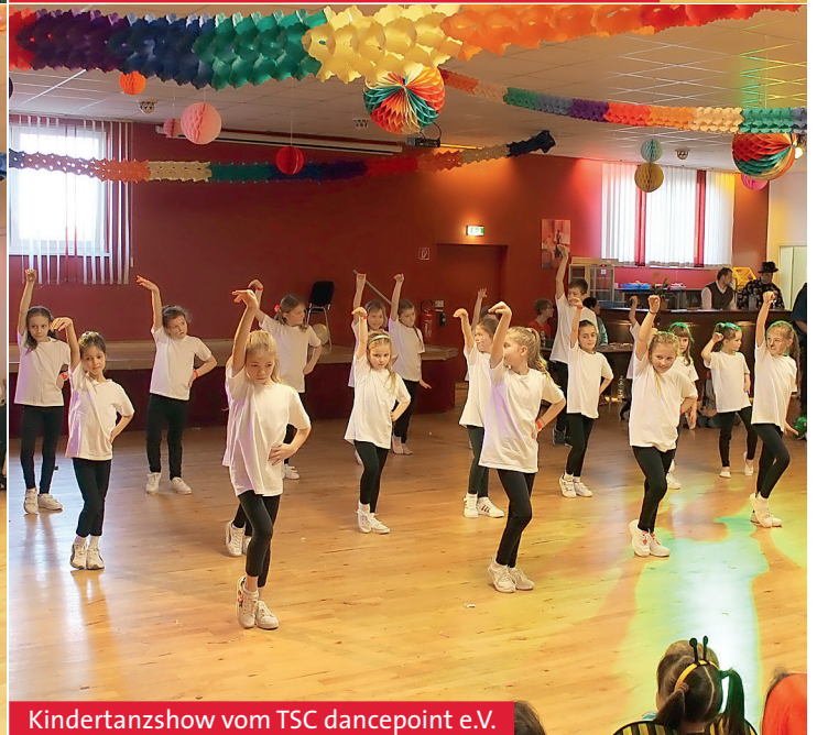
Kindertanzshow vom TSC dancepoint e.V.