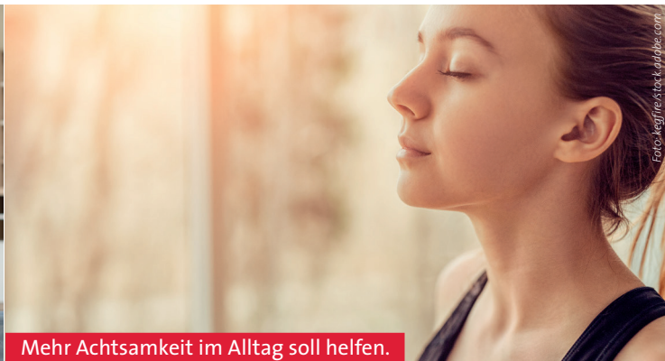
Mehr Achtsamkeit im Alltag soll helfen.