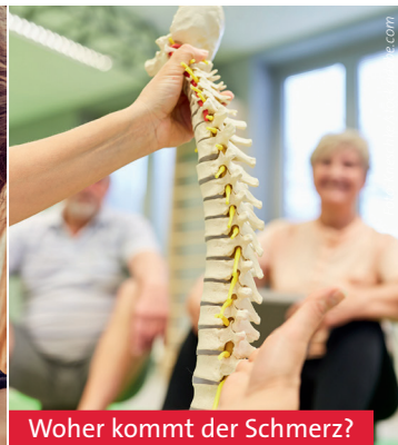
Woher kommt der Schmerz?