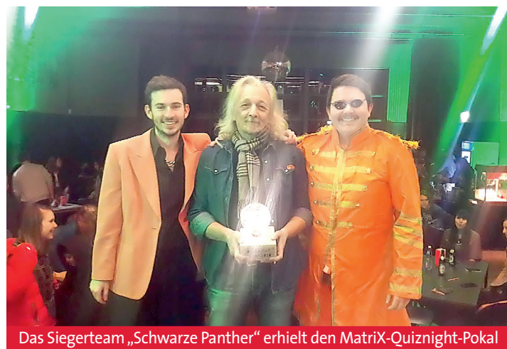
Das Siegerteam „Schwarze Panther“ erhielt den Matrix-Quiznight-Pokal

Bühnen-Leinwand projiziert wurden. Und auch Fans von physikalischen und chemischen Experimenten kamen auf ihre Kosten: Wer hätte vorher gewusst, was mit einer Gabel in einem Wasserglas mit Salz, Soja-Soße und einer Batterie passiert? Mit großem Trommelwirbel ging das Team „Schwarze Panther“ als knapper Sieger hervor, erhielt einen vom MatriX-Team künstlerisch hochwertigen und selbstgebauten Quiznight-Pokal, ein Gesellschaftsspiel und na-