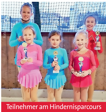
Teilnehmer am Hindernisparcours

ren Schulen abgelegt haben. Um das Angebot in der Region besser bekannt zu machen, veranstaltet die Fritz-Felsenstein-Schule am 13. März ab 8.30 Uhr einen Tag der offenen Tür zum BVJ. Schüler und Eltern sind herzlich eingeladen, an Workshops und Informationsveranstaltungen zum Konzept und den Lerninhalten teilzunehmen. Anmeldungen nimmt das Schulsekretariat unter der Rufnummer 08231/ 6004-201 oder per Mail an kathrin.rummel@felsenstein.org entgegen. Zum Beitrag: www.myheimat.de/3132353