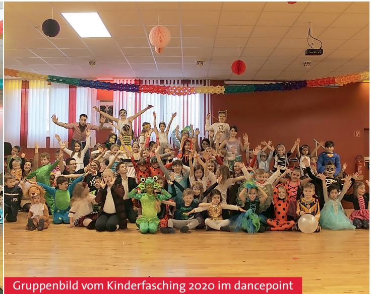
Gruppenbild vom Kinderfasching 2020 im dancepoint