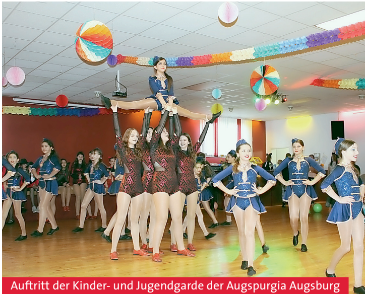
Auftritt der Kinder- und Jugendgarde der Augspurgia Augsburg