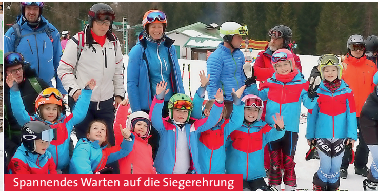
Spannendes Warten auf die Siegerehrung