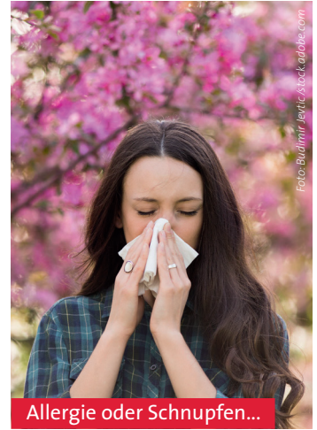
Allergie oder Schnupfen...

Neben der Behandlung kann für starke Allergiker eine Hyper- oder Desensibilisierung in Frage kommen, die erfolgreich vom Heuschnupfen heilen kann. Hier berät und klärt der behandelnde Arzt auf.