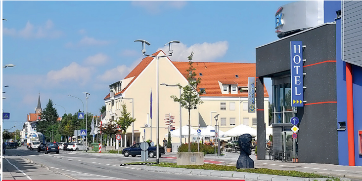
Ein Blick in die Bürgermeister-Wohlfarth-Straße