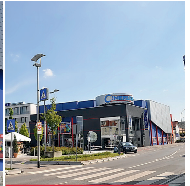
Kinovergnügen im Cineplex