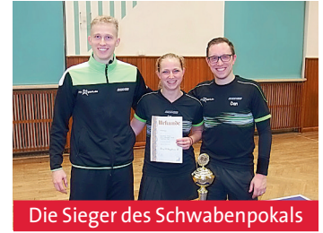
Die Sieger des Schwabenpokals