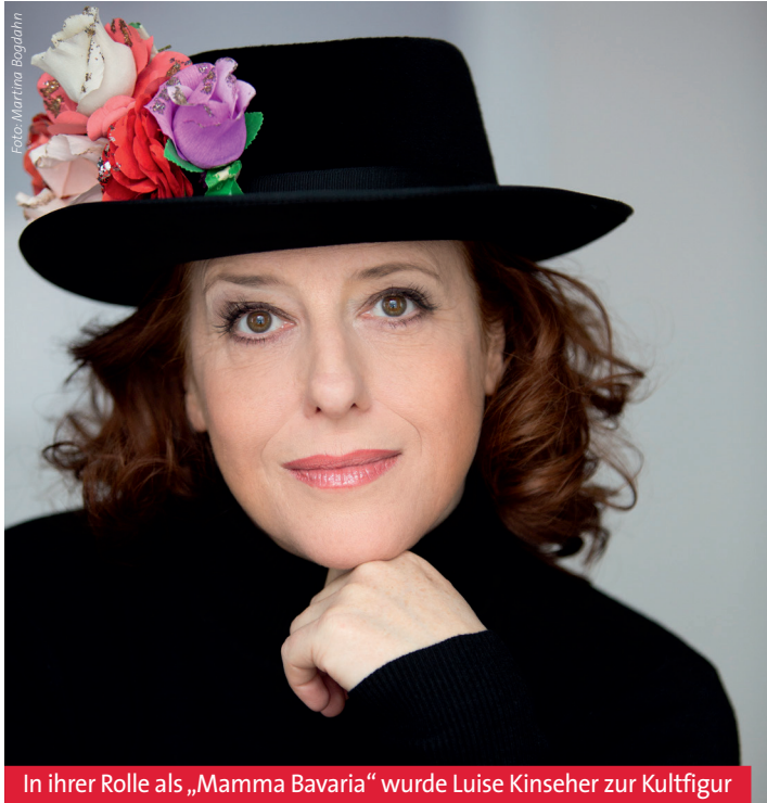
In ihrer Rolle als „Mamma Bavaria“ wurde Luise Kinseher zur Kultfigur