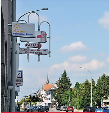
Geschäfte und Dienstleistungen