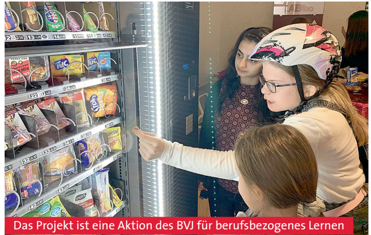
Das Projekt ist eine Aktion des BVJ für berufsbezogenes Lernen